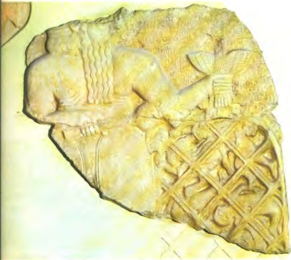
La llamada "estela de los buitres", de mediados del III milenio (Museo del Louvre, París), que conmemora una victoria de Eannatum, rey de Lagash, sobre una ciudad enemiga. Un dios tiene a los enemigos atrapados en una red y lleva una maza en la mano para golpearlos.

Muchas dinastías hubieron de ser contemporáneas, y sus monarcas no extendieron su autoridad más allá de su capital y territorio circundante.